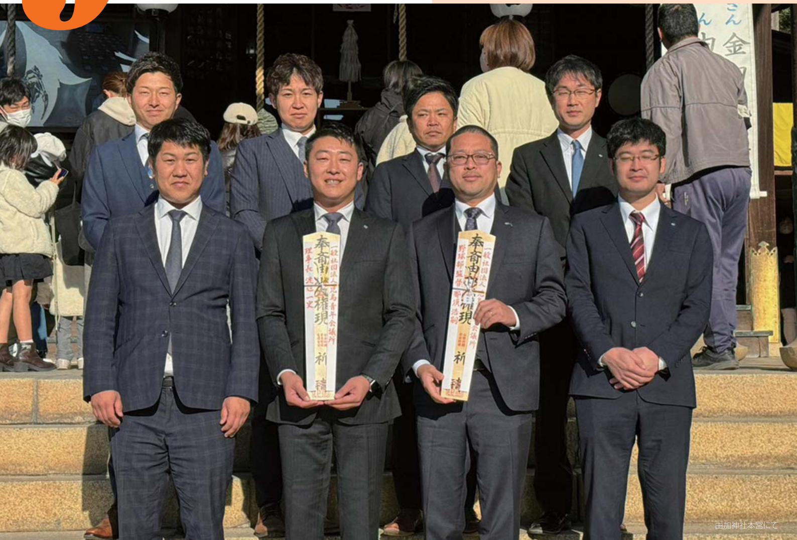
由加神社本宮にて